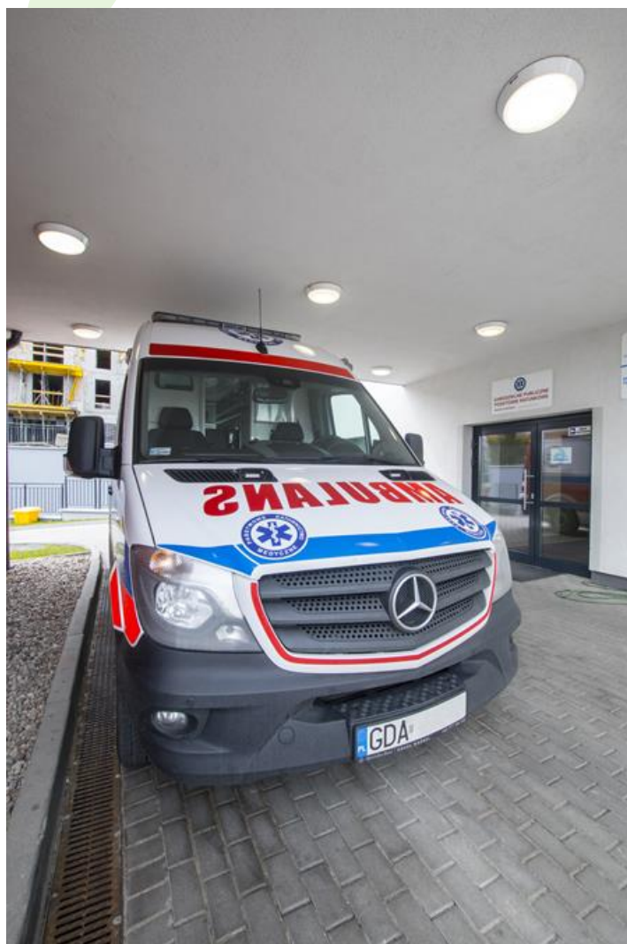
Samodzielne Publiczne Pogotowie Ratunkowe, Pruszcz Gdański

Oprawa przeznaczona do montażu nastropowego na suficie lub ścianie, wyposażona w wysokowydajne panele LED. Korpus oprawy i przesłona wykonane z tworzywa odpornego na uderzenia IK10. Oprawa hermetyczna IP65. Oprawa rekomendowana do pomieszczeń typu: łazienki, sale chorych, pomieszczenia personelu medycznego, jak również na zewnątrz.