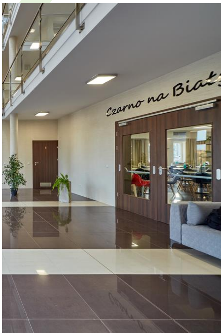
Hotel "Czarno na białym", Kraków

Oprawa przeznaczona do montażu nastropowego, do źródeł LED. Kaseton oprawy wykonany z blachy stalowej, lakierowanej proszkowo. Oprawa rekomendowana do: sal chorych, łazienek komunikacji szpitalnej. Stopień szczelności IP44.