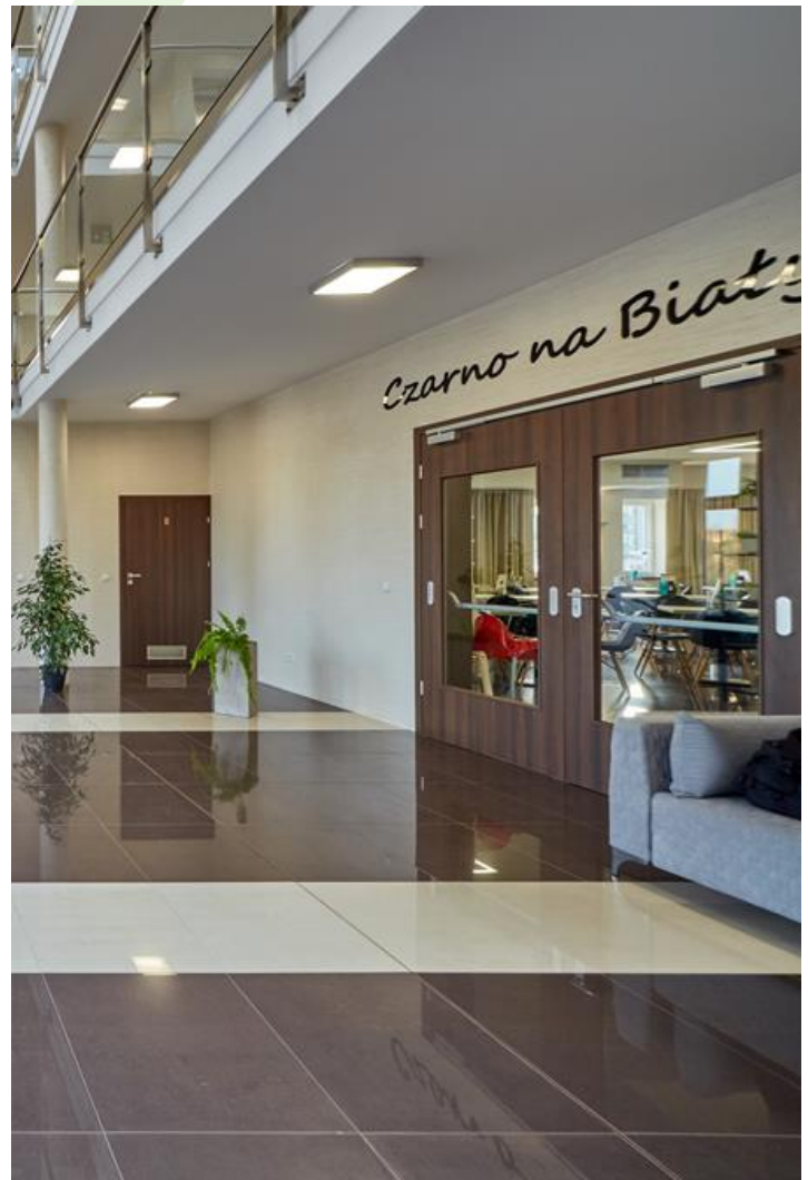
Hotel "Czarno na białym", Kraków

Oprawa przeznaczona do montażu nastropowego, do źródeł LED. Kaseton oprawy wykonany z blachy stalowej, lakierowanej proszkowo. Oprawa rekomendowana do: sal chorych, łazienek komunikacji szpitalnej.