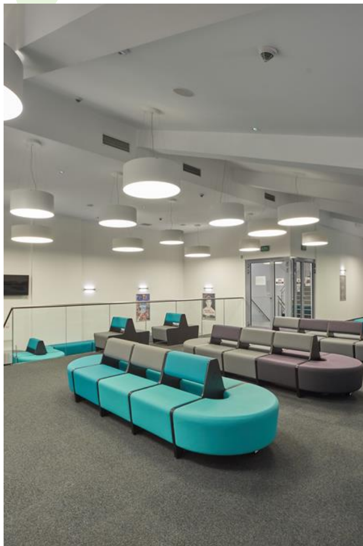
Centrum Kultury, Koźienice

Oprawy stosowane w obiektach użyteczności publicznej typu: banki, biura, hotele, sklepy, szkoły, czyli tam gdzie wymagane jest stworzenie przyjemnego wizualnie otoczenia. Nadają wnętrzą wyszukanej elegancji i podkreślają ich indywidualny charakter. Specjalna konstrukcja oprawy i zastosowane przesłony pozwalają ograniczyć oślnienie. Kaseton oprawy wykonany z blachy stalowej malowanej proszkowo. Przesłona opalizowana.