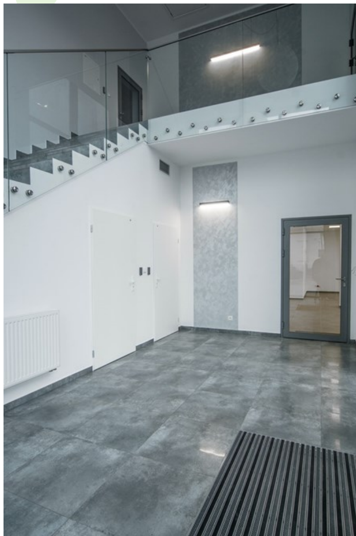
Biuro Elclim, Toruń

Oprawa przeznaczona do montażu na ścianie. Korpus wykonany z anodowanego profilu aluminiowego. Oprawa wyposażona w wysokowydajne źródła światła LED. Przesłona wykonana z polimetakrylanu metylu w kolorze białym o wysokiej przepuszczalności światła. Przesłona bez ramki montażowej. Oprawa charakteryzuje się wysoką skutecznością świetlną. Zastosowanie: biura, sale konferencyjne, korytarze, klatki schodowe itp.